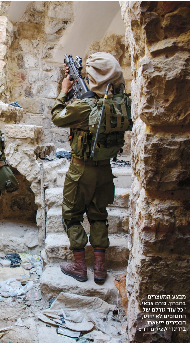
מבצע המעצרים בחברון. גורם צבאי: "כל עוד גורלם של החטופים לא ידוע, הבכירים יישארו בידינו"