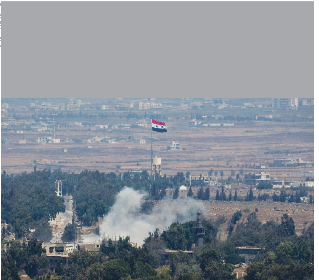
חילופי אש בין צבא סוריה למורדים בקירבת קונייטרה, אתמול בגולן. "בשלב מסוים זה ישפיע עלינו"

ביום שישי סרטון מזעזע המציג הוצאה להורג של חייל כורדי, בתגובה לשיתוף הפעולה הצבאי בין הכורדים לאמריקאים בצפון עיראק.